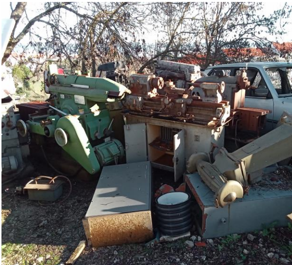
Oficinas no Edifício dos Paços do Concelho